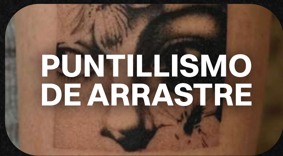
PUNTILLISMO DE ARRASTRE